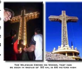
THE MILLENIUM CROSS ON VODNO, THAT CAN BE SEEN IN RADIUS OF 50 KM, IS 66 METERS HIGH

Milenijumski krst će dobiti lift. U Skoplju je 2000. godine sagrađen Milenijumski krst koji se može videti u prečniku od 50 km, koji simbolizuje 2000 godina Hrišćanstva. Ovaj krst dimenzije 66 i 20 m, kao jedinstvena građevina u svetu, uskoro će dobiti lift koji će prenositi posetioce do njegovog vrha na Vodno planini, visine 1066 m.