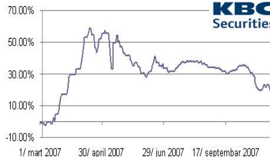
Promena vrednosti u %