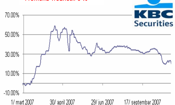
Promena vrednosti u %