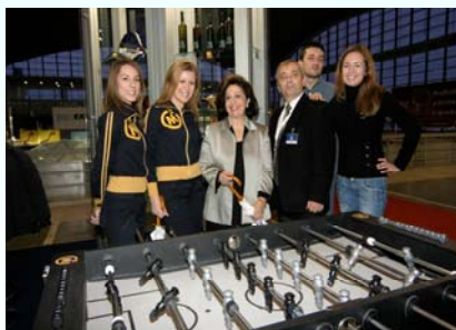
Princeza Katarina je uživala u stonom fudbalu

Svi posetioci koji tokom tri dana trajanja Brand Faira posete štand kompanije Mozzart , imaće priliku da učestvuju u nagradnoj igri. Dva takmičara će osvojiti po bicikl, a predviđeno je i mnogo drugih vrednih nagrada. Posetioci će moći i da se uvere zašto je Mozzart najprepoznatljiviji brend u svojoj delatnosti u Srbiji i regionu. Kompanija kroz svoj Program lojalnosti brendu , jedinstvenom na ovim prostorima, kontinuirano održava poverenje korisnika tako što celu svoju poslovnu strategiju i brend zasniva na neprekidnom inovativnom sagledavanju potreba potrošača, osmišljavanju najefikasnijeg puta za izlazak u susret tim potrebama i konačno, fer odnosu prema korisnicima usluga. Takva poslovna politika omogućila je da se brend i kompanija Mozzart prošire i na tržišta Republike Srpske, Rumunije i Makedonije, sa realnim šansama da se osvoji liderska pozicija i na tim tržištima.