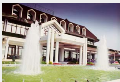
Kulsko jezero, lokacija održavanja Forumu

„Po prvi put se privreda samoorganizuje i aktivira, a Skupština opštine Kula i lokalne samouprave okruga su samo servis jer verujemo da je poslednji trenutak za ovaj korak. Zapadna Bačka ima potencijal da postane vodeće i strateško razvojno tržište jer je na tromeđi između Srbije, Mađarske i Hrvatske. Moramo se spremiti i što je takođe važno: raditi zajedno“ –