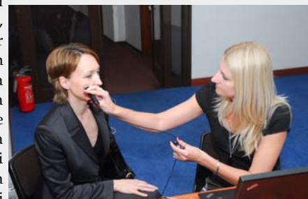
Stručnjaci Multiaktiv kompanije vrše analizu i dijagnostiku kože putem Skin testa